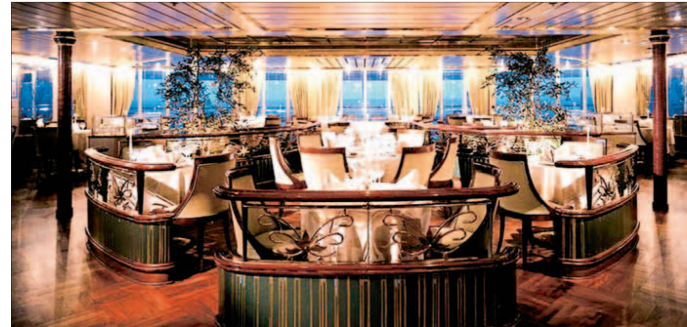
Med tre restauranter er der ingen køer og ingen faste middagstider.