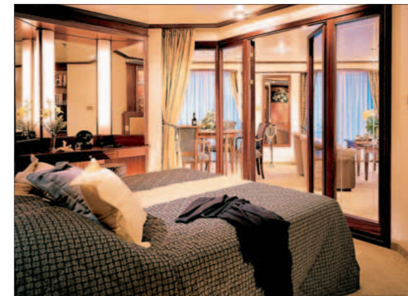
Hvis man ikke gider andre mennesker, er der gratis roomservice 24 timer, som i restaurantens åbningstid serverer den samme mad som i restauranten.